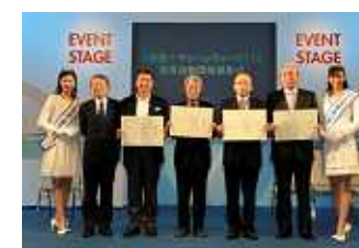
2011年優秀団体表彰 (2012年3月1日ボートショーステージ)